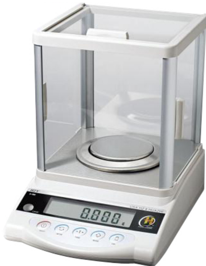
Balanza de Precisión BL-HZYA200