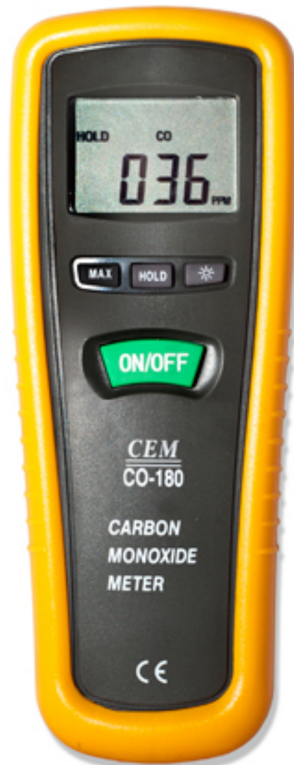
Medidor de Monóxido de Carbono CM-CO180